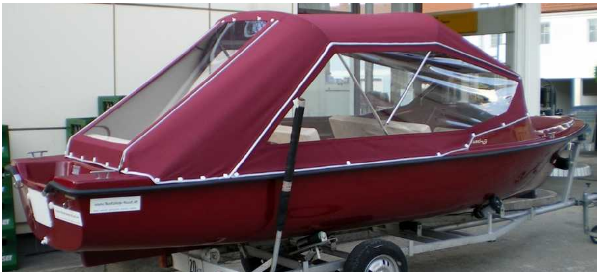
Das Verdeck ist hoch genug um ohne umlegen aus- und einsteigen, sowie zwischen den Sitzreihen wechseln zu können