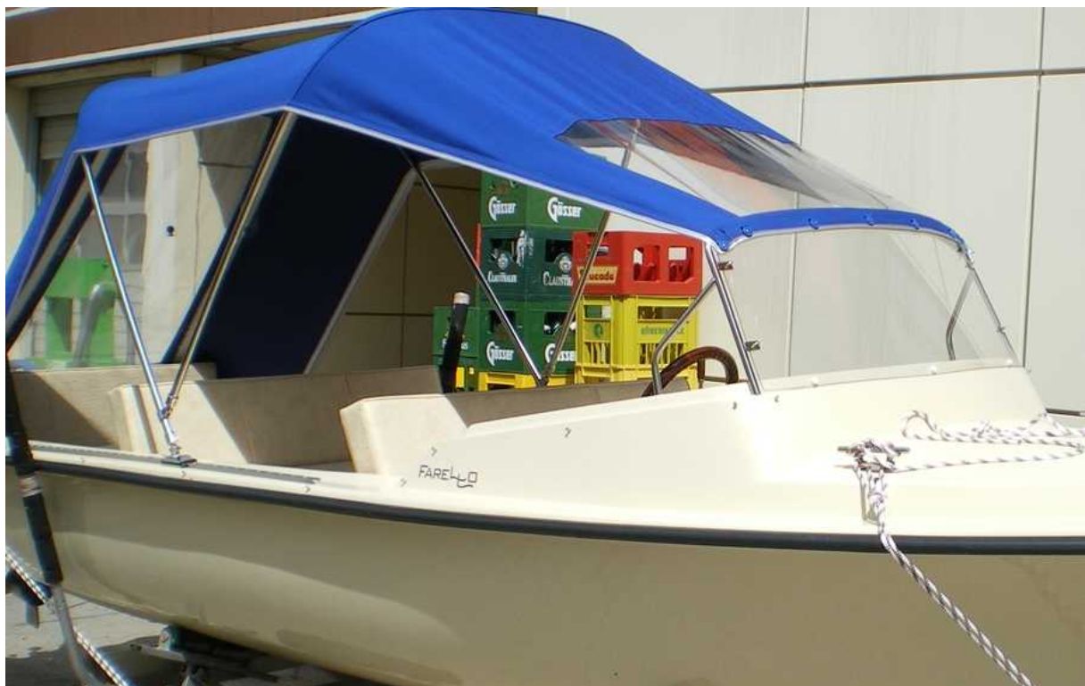
Bei abgenommenen Seitenteilen bleibt ein großzügiges und stabiles Sonnendach