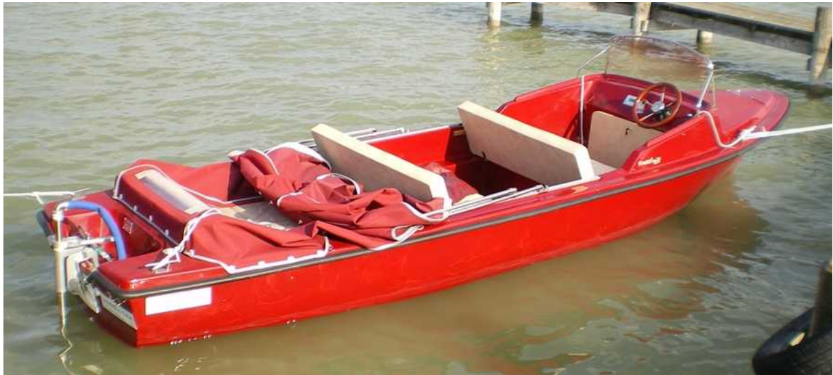
Eine Variante komplett in rot mit Polsterung in beige