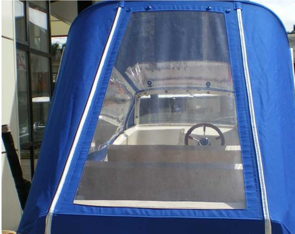
Das große Heckfenster ist hochrollbar